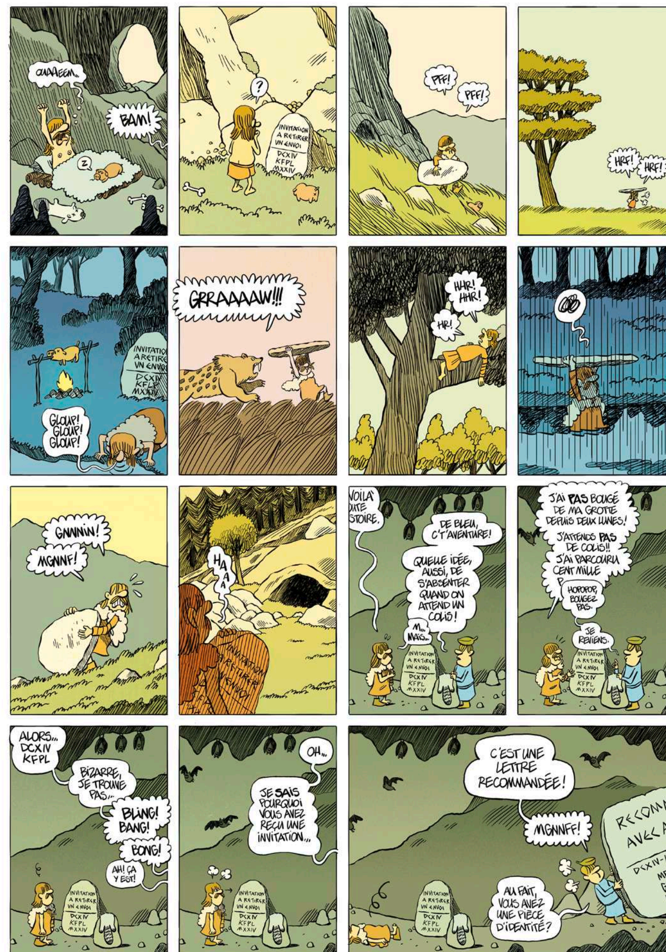
Guillaume Long (dessin et scénario) et Isabelle Merlet (couleur) pour BDFIL, 2024

Et pour célébrer la fin de l'aventure humoristique de la série de RTS Couleur 3, l'équipe de Bon Ben Voilà a concocté un best of, suivi de la projection de Monty Python and the Holy Grail , la version désopilante de la légende du roi Artur par Terry Gilliam et Terry Jones. Un programme faisant dialoguer les septième, huitième et neuvième arts, à savourer sans modération sur le grand écran du Cinéma Capitoile de la Cinéma-thèque suisse, le 19 avril à 19h15. Billetterie cinematheque.ch.