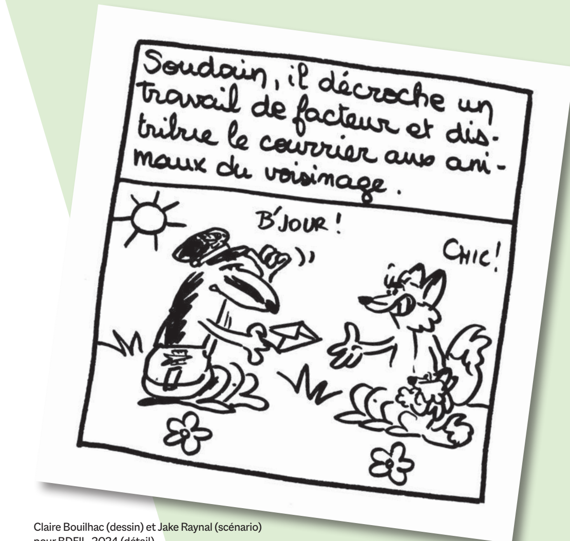
Claire Bouilhac (dessin) et Jake Raynal (scénario) pour BDFIL, 2024 (détail)

Le festival vous propose ainsi de découvrir toutes les façons dont l'idée passe à l'écrit et au