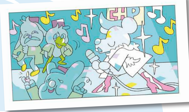
Elodie Shanta pour BDFIL, 2024 (détail)

Lausanne à table et BDFIL enfilent leur toque et vous convient à un événement drôle, culinaire et dessiné qui ravira les gourmands des arts de la table comme du crayon.