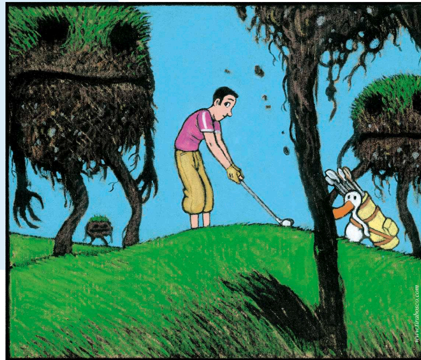
Tom Tirabosco, Le soulèvement des mottes de terre , dessin pour la Tribune de Genève , 2009

Cela dit, si nous espérons que cette exposition rende un peu justice à la bande dessinée d'humour en présentant au public ses différents aspects, nous avons surtout choisi les planches que nous présentons pour qu'elles remplissent au mieux le rôle de l'humour: déclencher des éclats de rire!