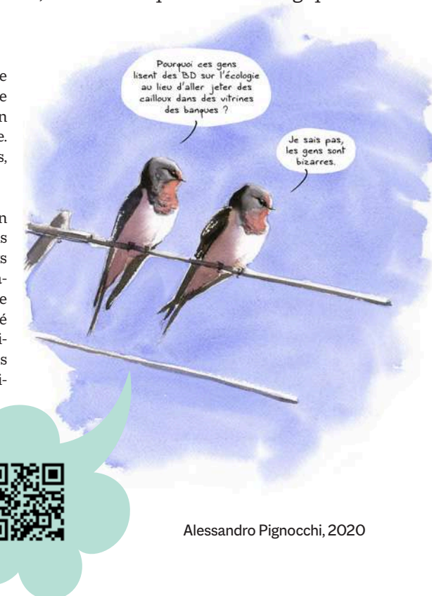
Alessandro Pignocchi, 2020

Pour ne rien manquer de cette première édition des Ecotopiales, nous vous encourageons à vous inscrire à la newsletter de l'Observatoire des récits et imaginaires de l'Anthropocène (UNIL), qui organise le festival. Cet organisme de recherche, de veille et de prospective scientifique est rattaché au Centre de compétences en durabilité de l'Université de Lausanne, il rassemble des chercheuses et chercheurs en sciences humaines issus de disciplines multiples (littérature, sociologie, didactique, sciences du langage, etc.) qui ont identifié la recherche sur les récits et les imaginaires comme chantier prioritaire pour engager une transition écologique globale.