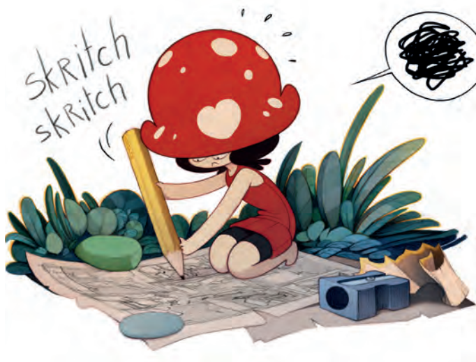
Extrait de La Petite Chapardeuse © Sûria Dudler