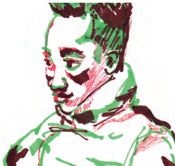
Angelo (détail) © Léandre Ackermann