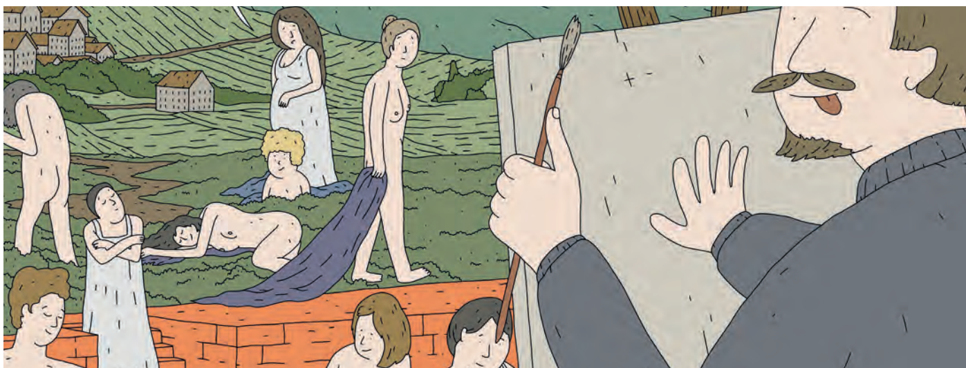
Planche pour BDFIL 2026 © Jehan Khodl