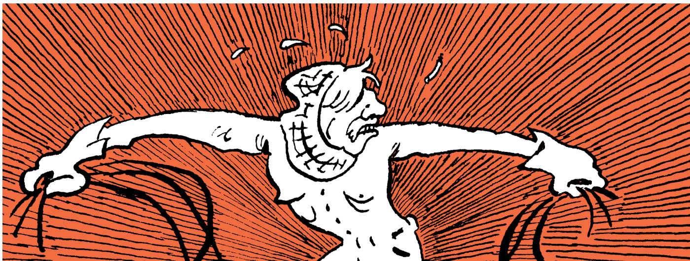
Extrait de Flèche © Simon Beuret, Atrabile