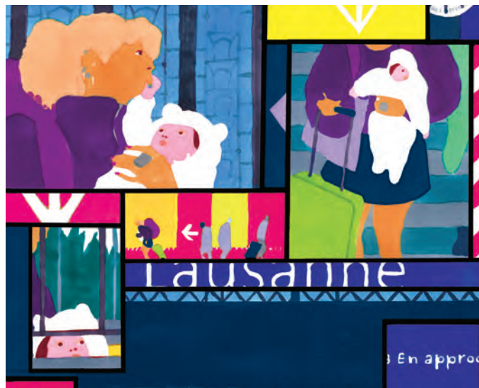
Planche pour BDFIL 2026 (détail) © Raphaël Geffray