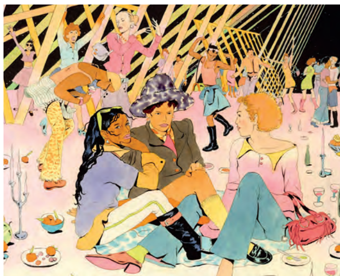
Affiche de l'exposition (détail) © Arthur Sevestre