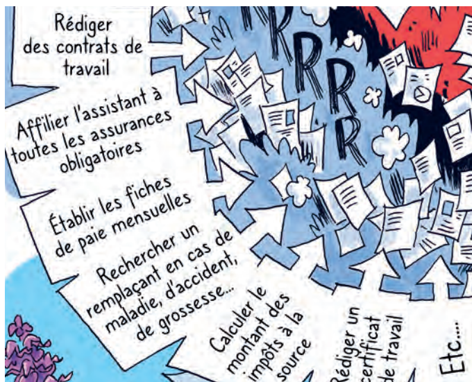
Planche de Mannaert Wauter pour BDFIL 2026 (détail) © Mannaert Wauter, BDFIL, HETSL