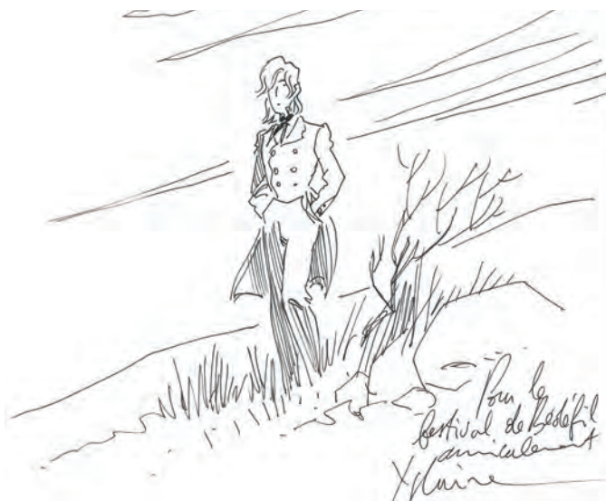
Extrait du dessin pour BDFIL 2006 © Bernard Yslaire, BDFIL